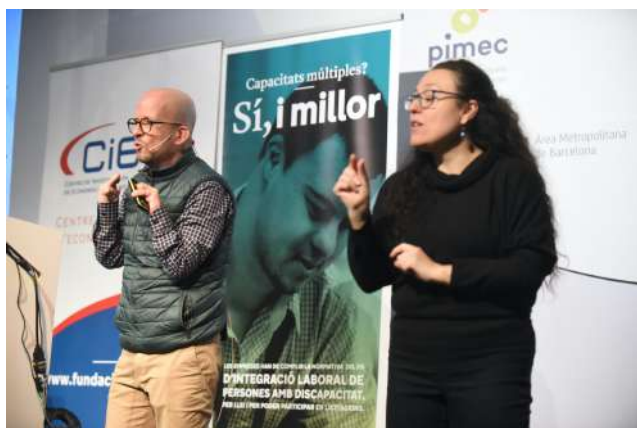
Servei d'interpretació de signes

Les mascaretes utilitzades eren inclusives al ser transparents y permetien la lectura labial, a més dissenyades i confeccionades íntegrament un Centre Especial d'ocupació.