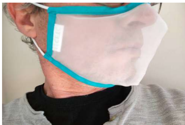
Mascareta accessible i segura