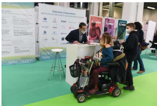
Imatges els l'espais fira Sí, i millor